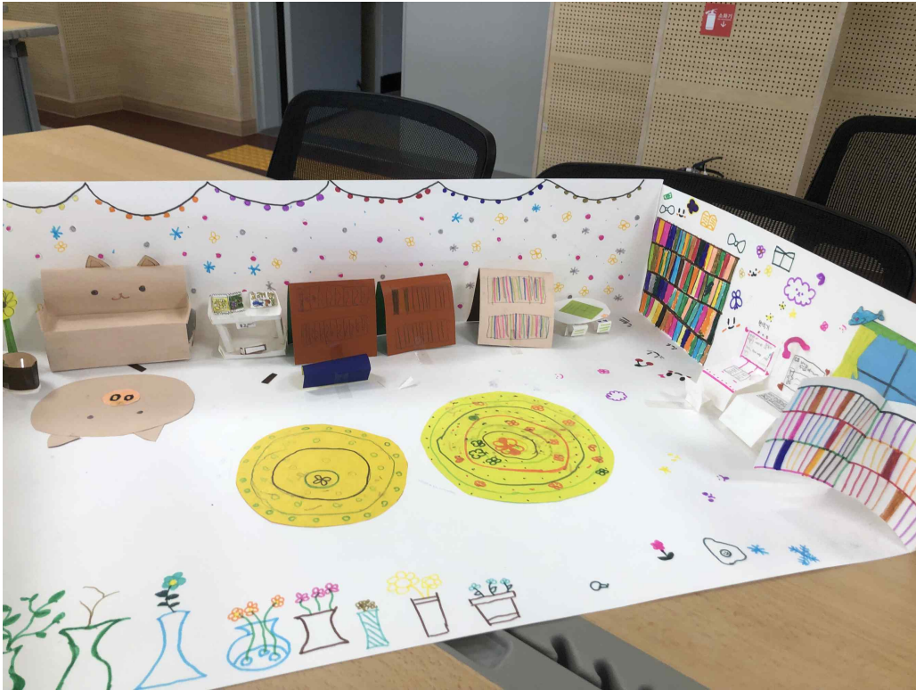
아이디어 스케치 예시1