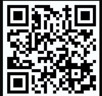
공연 영상 QR